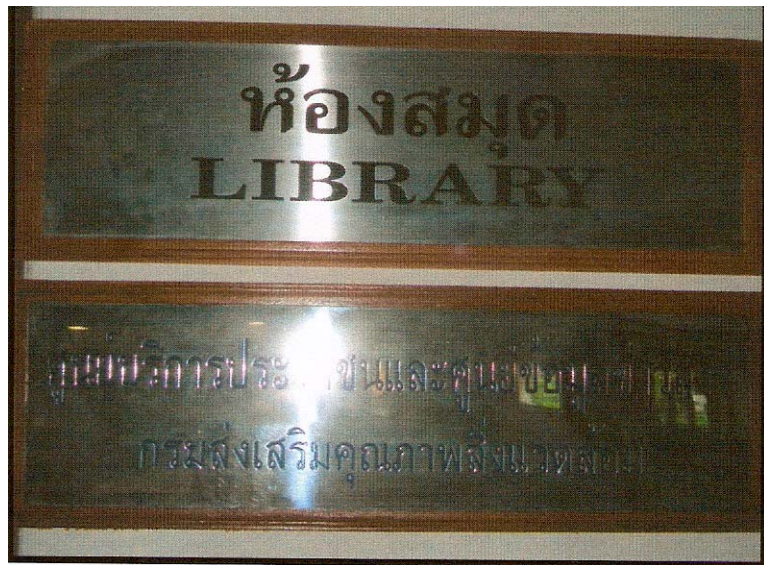
บริเวณหน้าศูนย์บริการประชาชน ชั้น 2