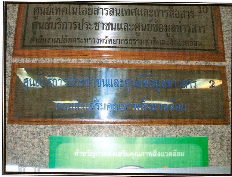
บริเวณหน้าลิฟท์ชั้น 1